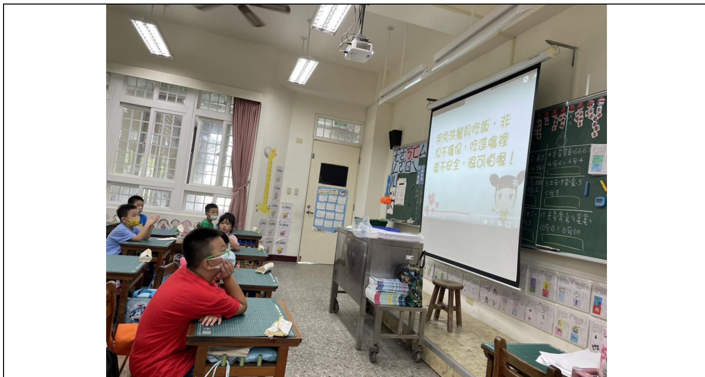
透過線上宣導如何垃圾減量