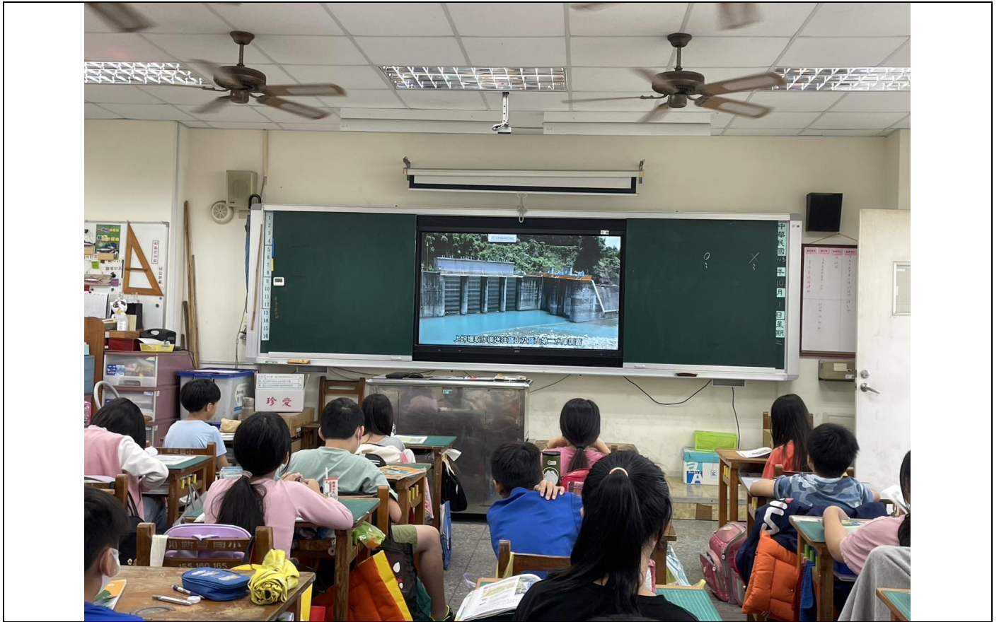
講師透過繪本閱讀的方式分享生活中如何節水