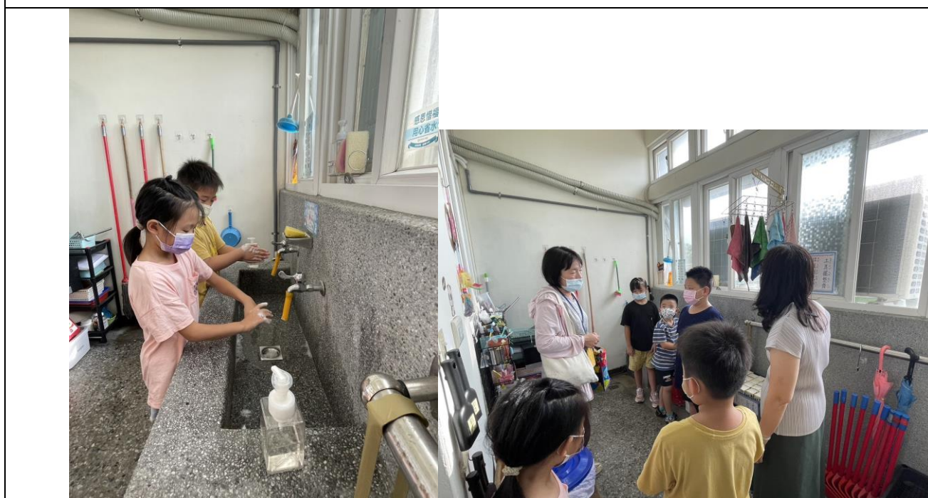
宣導洗手正確步驟