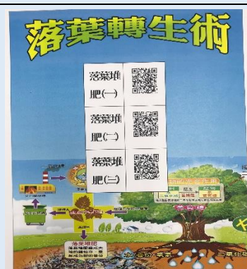
建置教學 QR Code