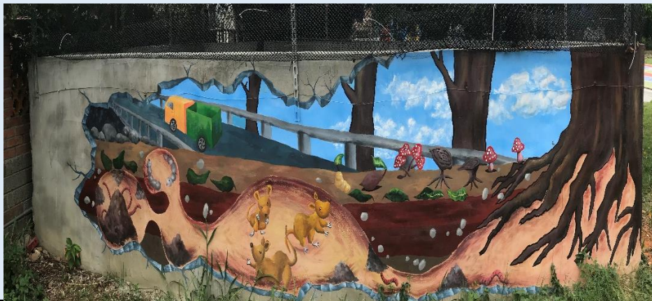
施工後～呈現生生不息的生態循環圖