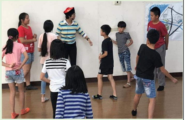
123 木頭人~誰是偷渡客