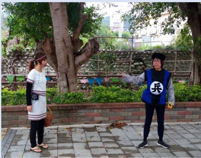
團員演出道卡斯族與漢族官兵的衝突