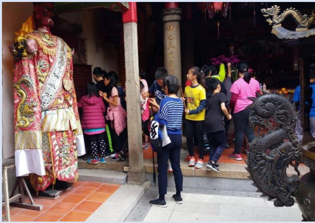
大家燒香拜拜為自己祈福