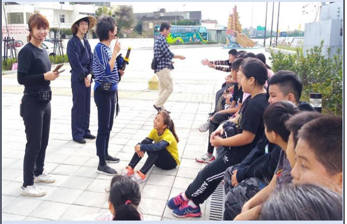
巫婆戲劇工作室的團員現場示範演出