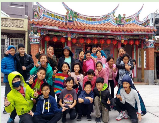
參觀新竹市香山天后宮