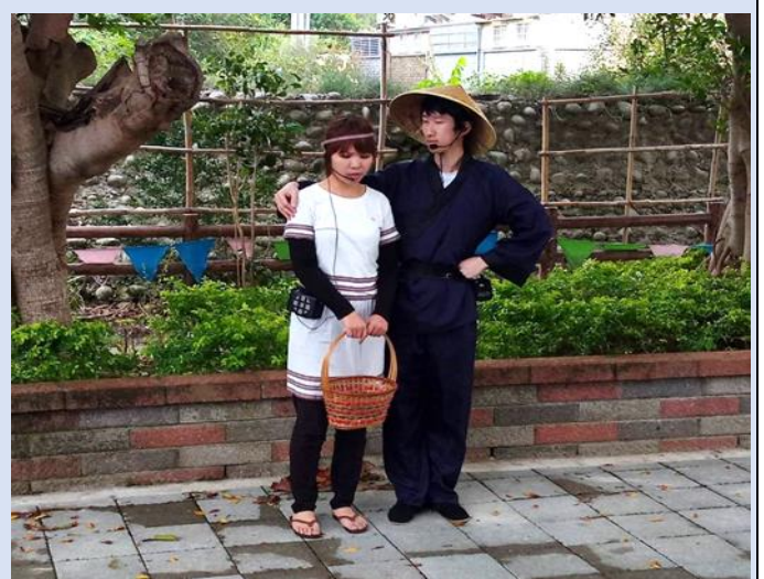
團員演出道卡斯族與漢族的和解與內心衝突