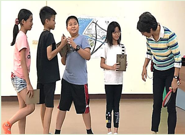
模擬要渡海時海關查護照