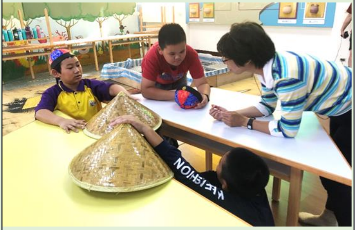
思考偷渡客的心情並想出自創劇本