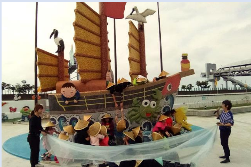
運用天后宮前的地景藝術，進行渡海移民渡過黑水溝的驚險情節