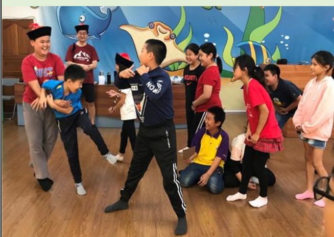
扮演偷渡客要闖海關