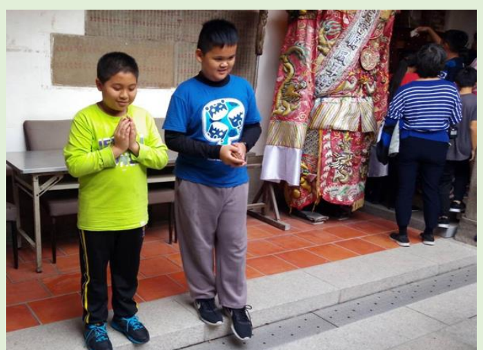
虔誠默拜祈福，想像要出海前先民祈福的心情