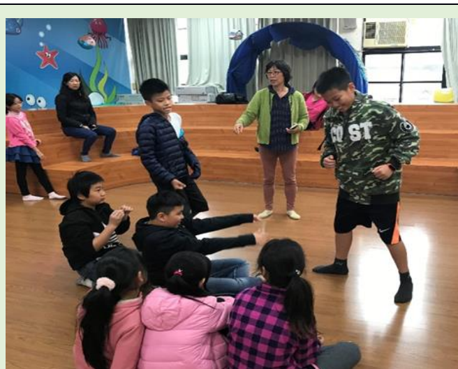
進行總排演的走位練習